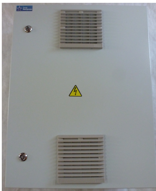
Рисунок 3.1 Внешний вид ТШ-ОВ

3.1 Внешний вид устройства показан на рисунке 3.1: