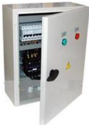
Рисунок 3.1 Внешний вид ЩАП

3.1 Внешний вид устройства показан на рисунке 3.1: