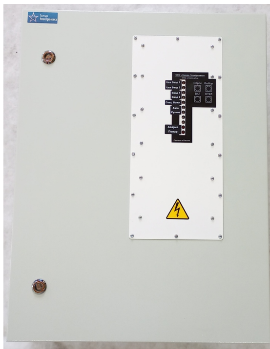
Рисунок 3.1 Внешний вид ШАВР

3.1 Внешний вид устройства показан на рисунке 3.1: