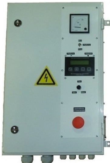
Рисунок 3.1 Внешний вид одного выпрямителя

Внешний вид выпрямителя представлен на рисунке 3.1: