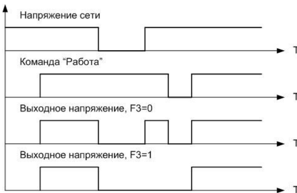
Рисунок 3.2 Применение функции F3

Применение функции F3 проиллюстрировано на рисунке 3.2: