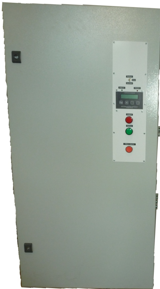
Рисунок 3.1 Внешний вид устройства