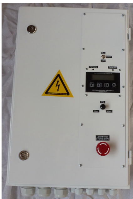
Рисунок 3.1 Внешний вид выпрямителя

Внешний вид выпрямителя представлен на рисунке 3.1: